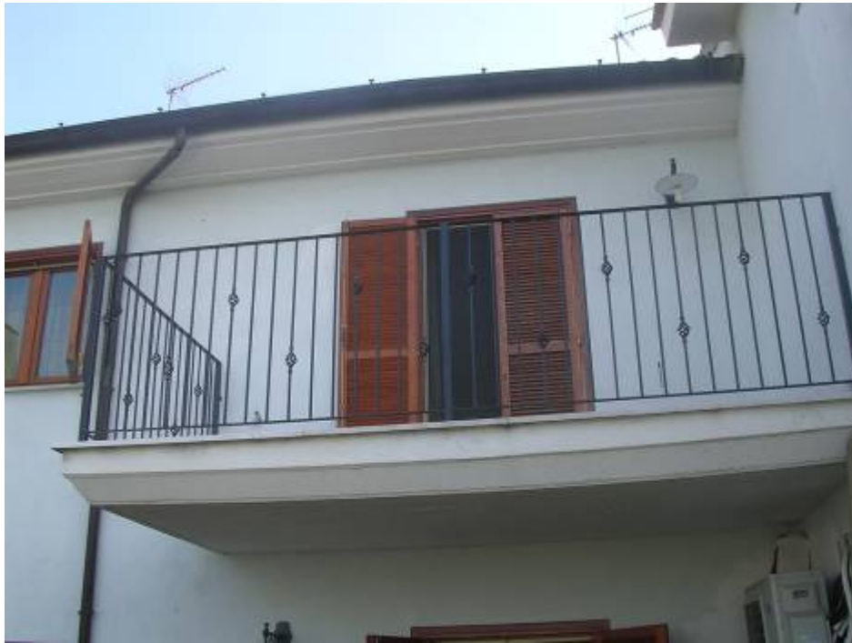
Vista prospetto sud