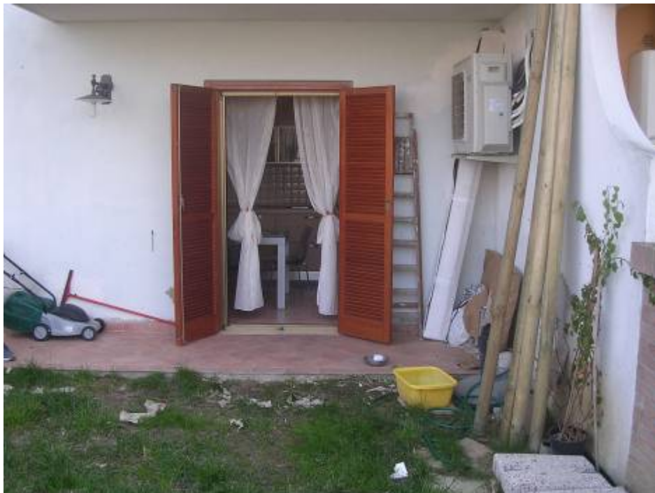
Vista corte interna (giardino)