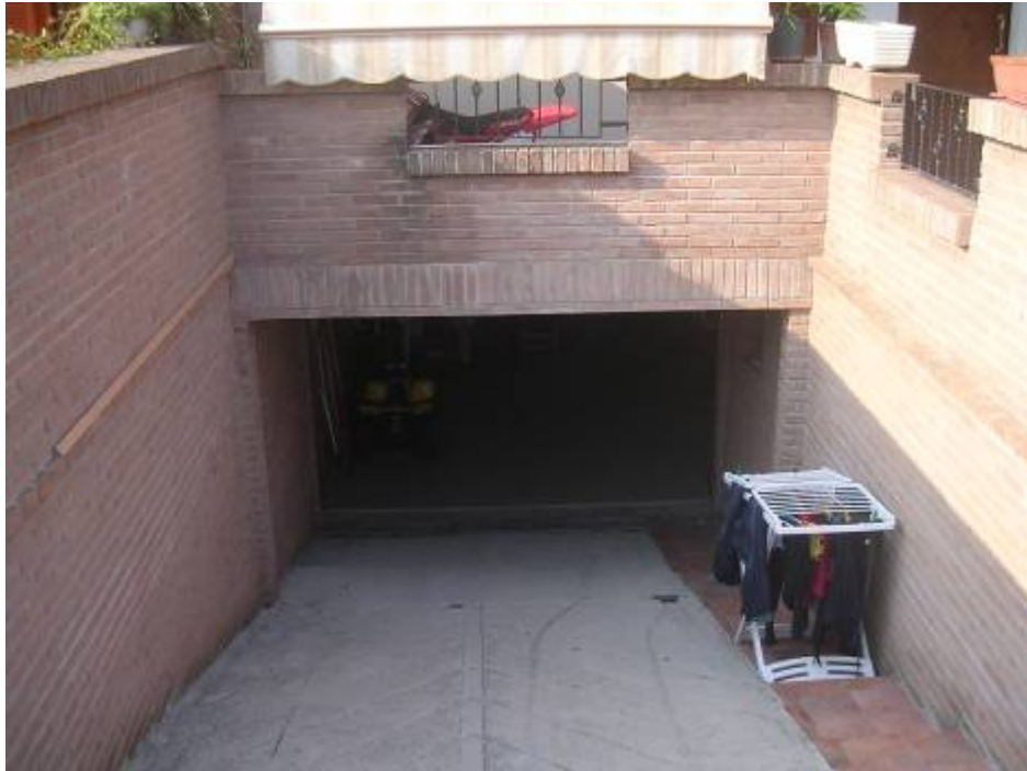
Rampa di accesso al seminterrato