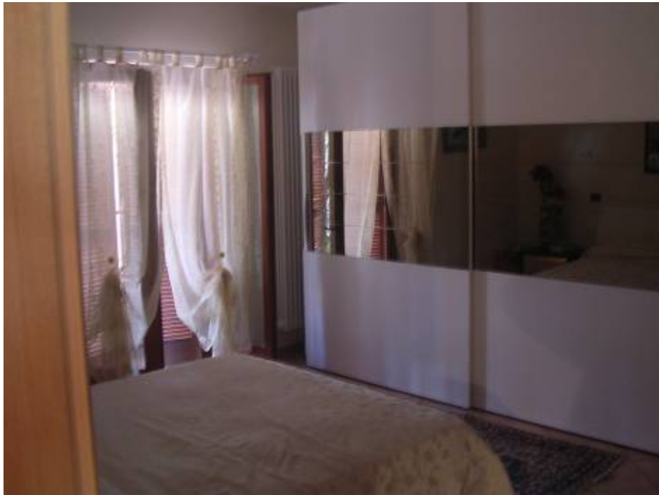
Vista camera piano primo