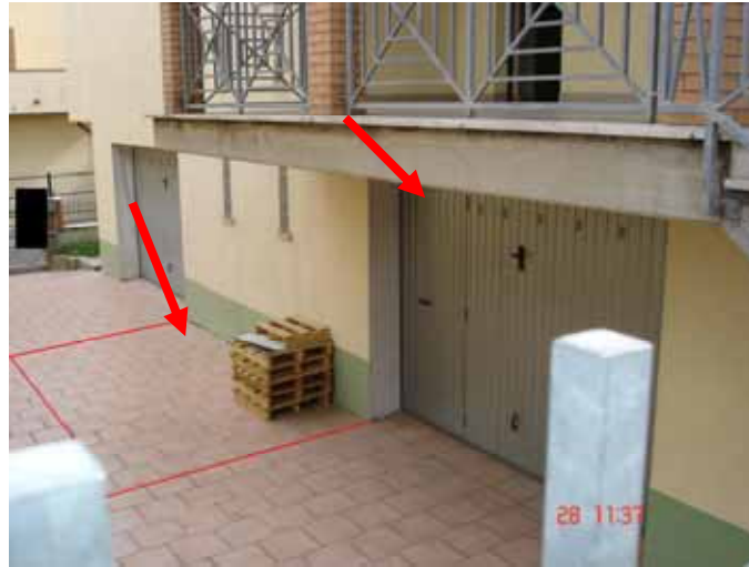
FOTO n° 4: Vista accesso al Box ed al posto auto scoperto lato Nord del fabbricato.