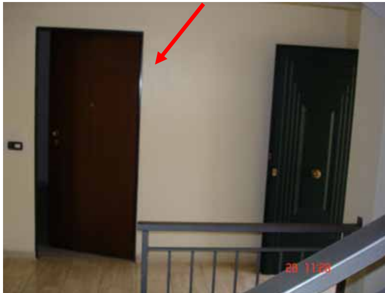
FOTO n° 10: Vista interna portoncino d'ingresso all'appartamento.