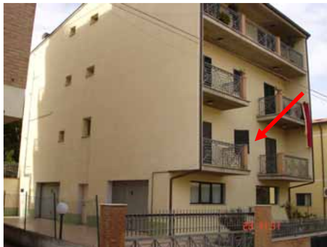
FOTO n° 3: Vista da Traversa di Via Matteotti, ingresso carrabile fabbricato lato Sud-Est e vista appartamento oggetto di relazione al Piano Rialzato.