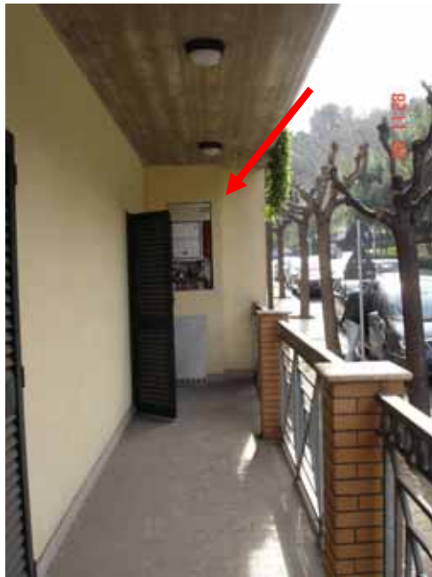
FOTO n° 20: Vista balcone e vano caldaia appartamento lato Ovest.