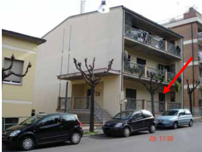
FOTO n° 1: Vista da Via Matteotti, ingresso fabbricato lato Nord-Ovest e appartamento oggetto di relazione.