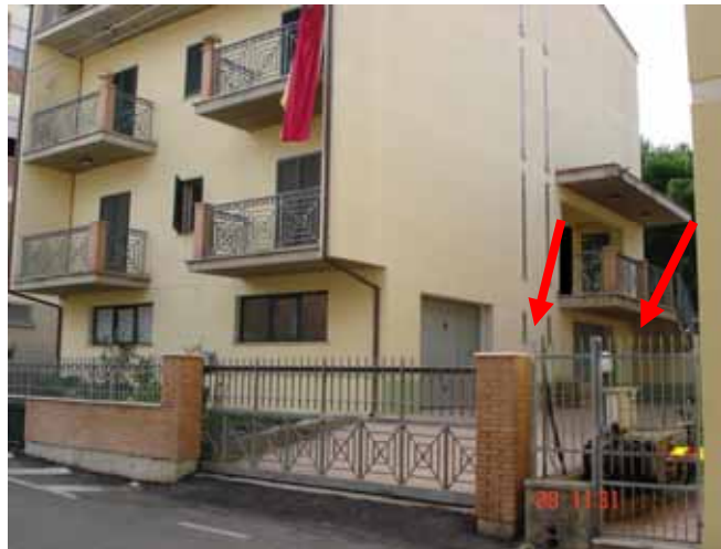
FOTO n° 2: Vista da Traversa di Via Matteotti, ingresso carrabile fabbricato lato Est, ingresso box e posto auto scoperto.