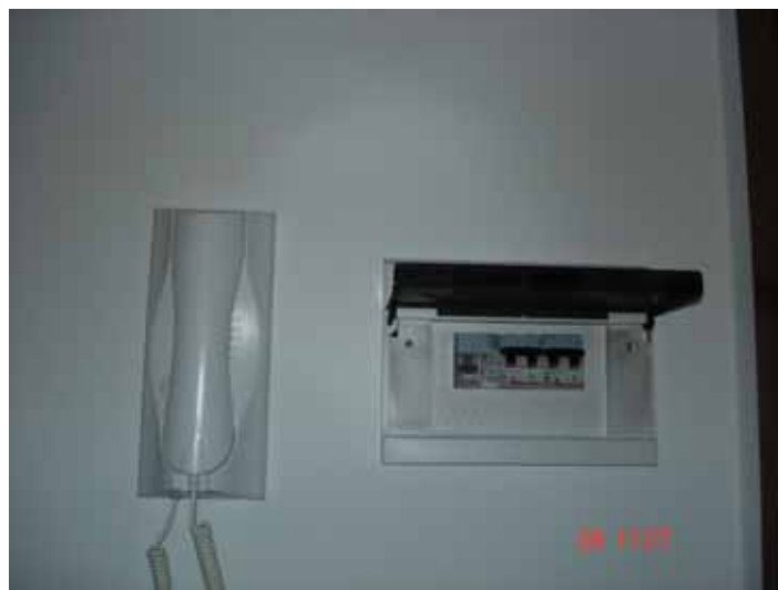
FOTO n° 18: Particolare quadro elettrico e citofono appartamento.