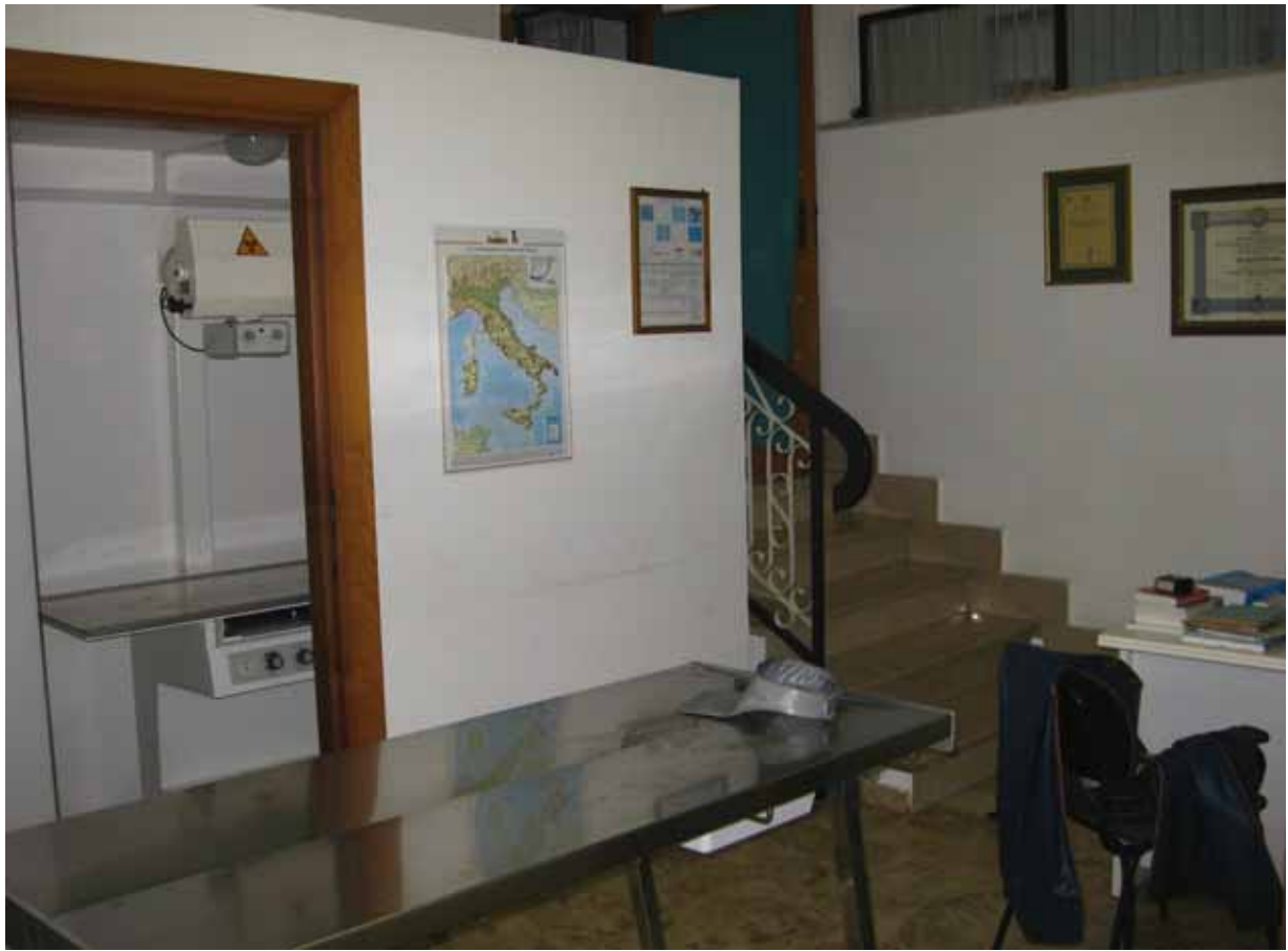
Foto n° 7: Particolare del vano scala interno di accesso ad altri due locali