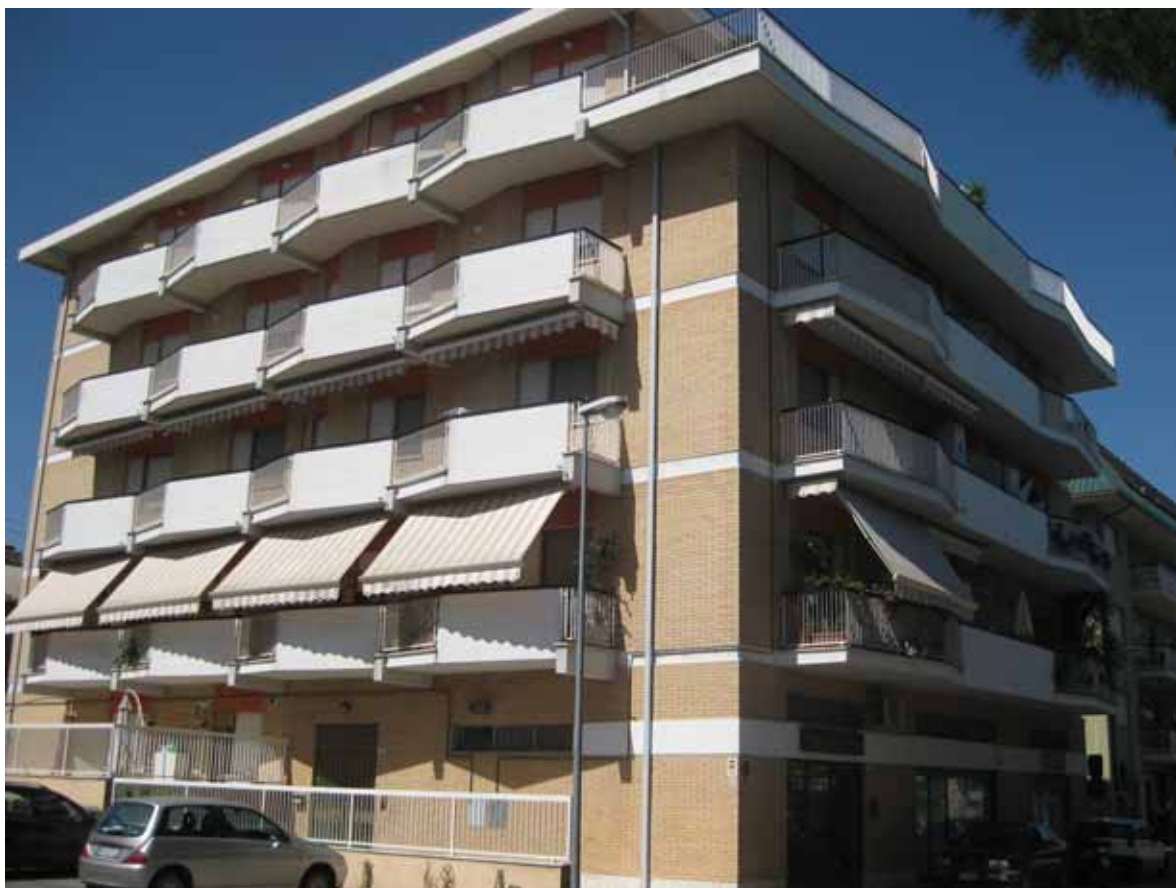
Foto n° 1: Vista del fronti sud ed ovest dell'edificio su cui risulta ubicata l'unità immobiliare