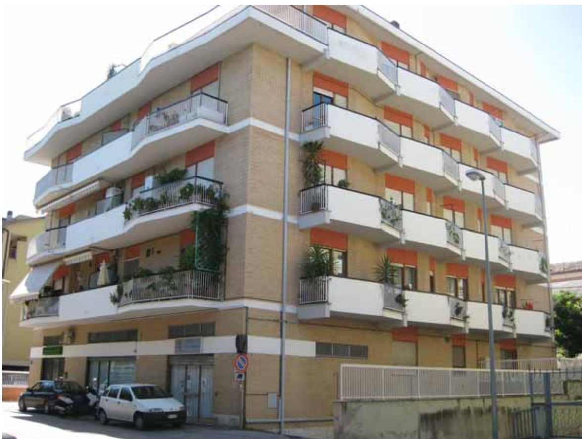
Foto n° 2: Vista del fronti sud ed est dell'edificio su cui risulta ubicata l'unità immobiliare