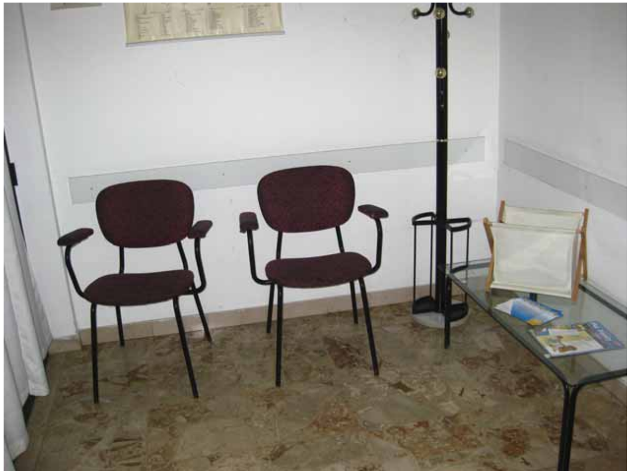
Foto n° 4: Interno dell'unità immobiliare adibita a ambulatorio veterinario – sala d'attesa