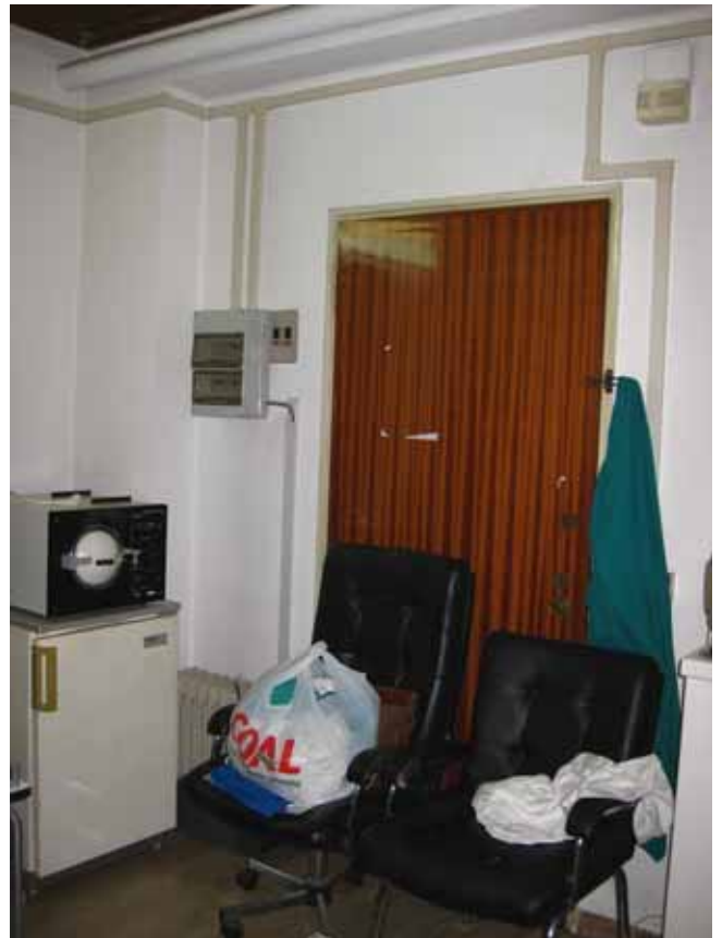
Foto n° 9 e n° 10: Viste del terzo locale su cui è ubicato un secondo accesso dal vano scala condominiale