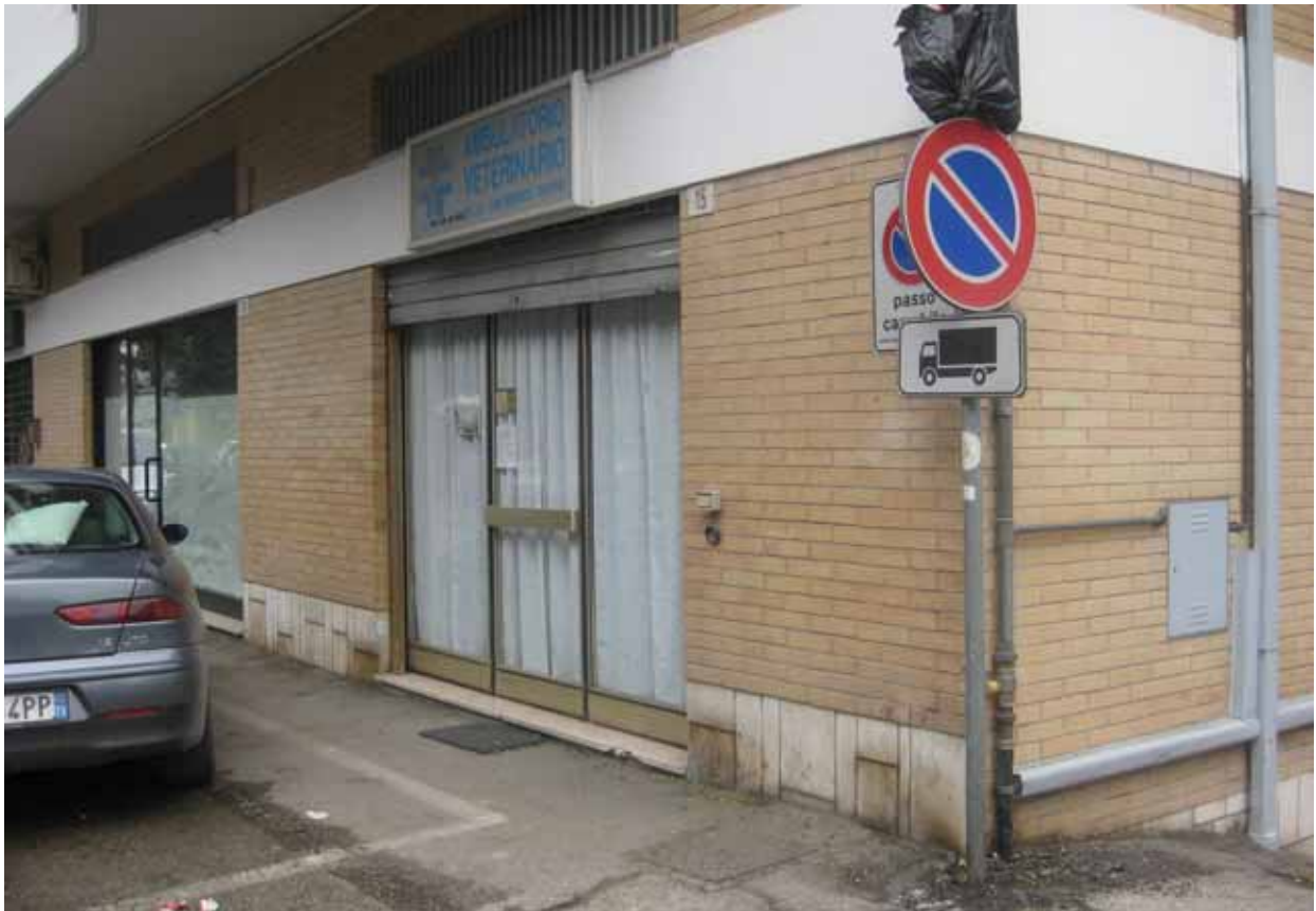
Foto n° 3: Vista dell'ingresso all'unità immobiliare da via Tripoti