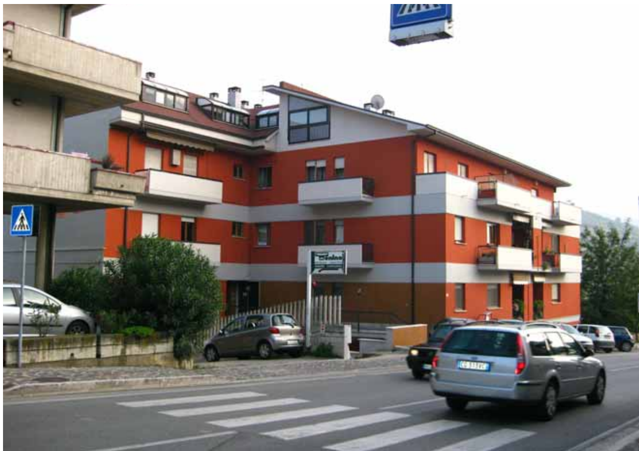
Foto n° 1: Vista del fronte principale dell'edificio su cui risulta ubicata l'unità immobiliare