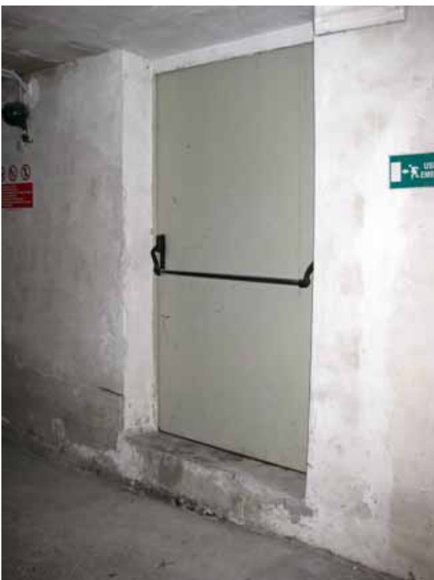
Foto n° 12: Porta di accesso al lastrico solare da passaggio condominiale esterno all'unità immobiliare