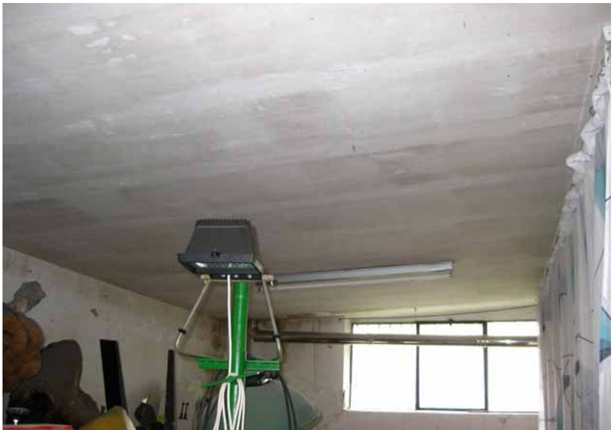
Foto n° 7: Particolare del solaio di copertura di una porzione dell'immobile