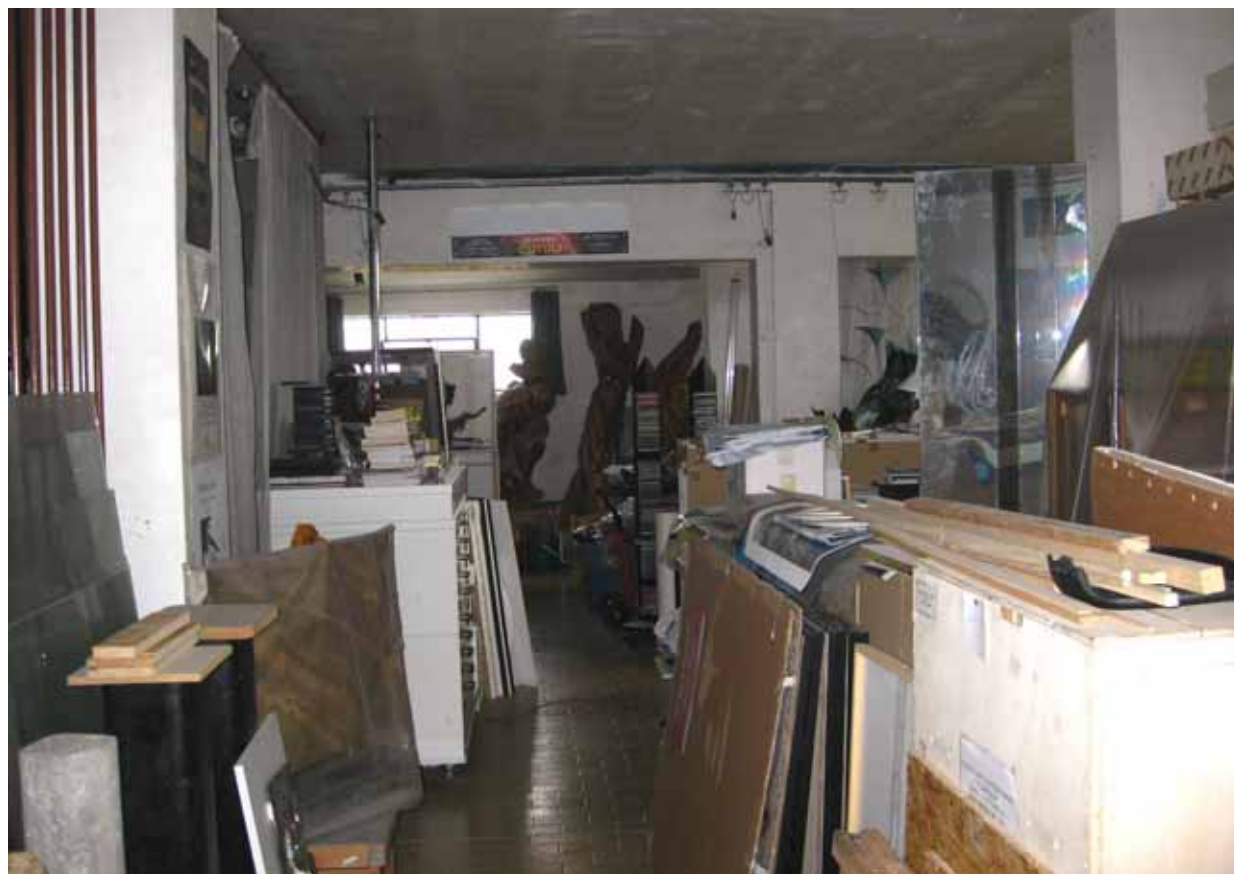
Foto n° 5: Interno dell'unità immobiliare adibita a laboratorio artistico