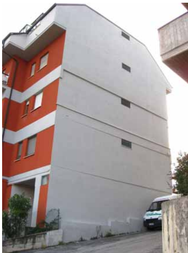
Foto n° 2 e n° 3: Vista dei fronti est e nord del fabbricato dove risulta l'immobile