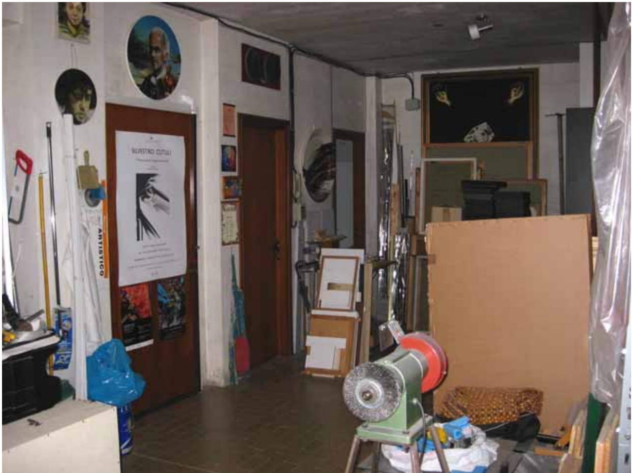
Foto n° 6: Interno dell'unità immobiliare adibita a laboratorio artistico