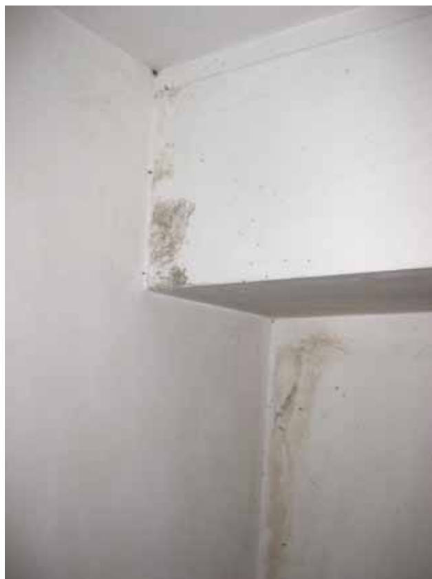
Foto n° 9 e n° 10: Particolari su problemi di infiltrazioni e macchie di umidità sulle pareti interne