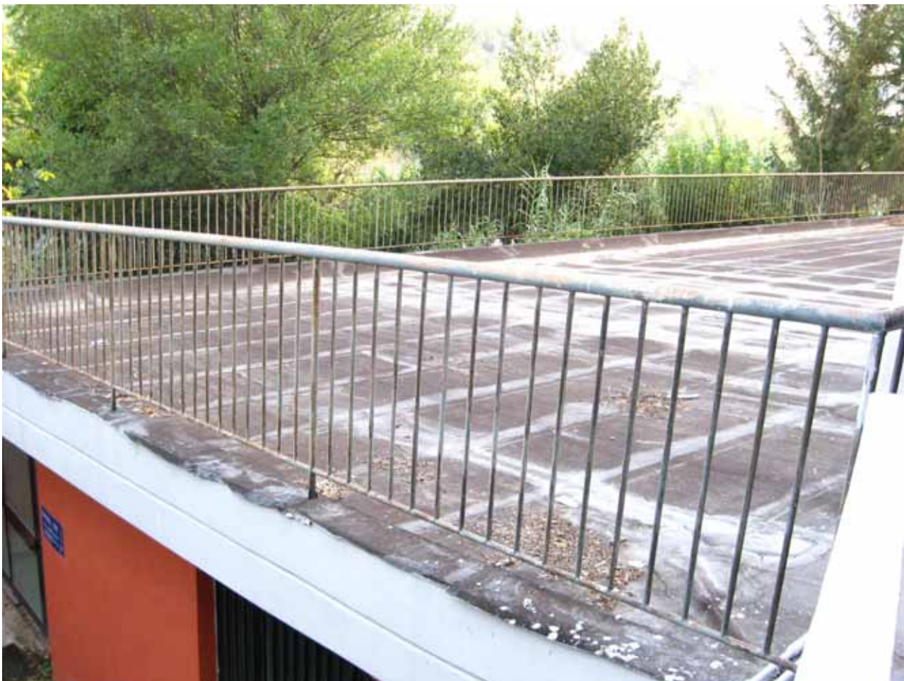
Foto n° 11: Particolare del terrazzo (lastrico solare) annesso all'unità immobiliare con unico accesso da passaggio condominiale