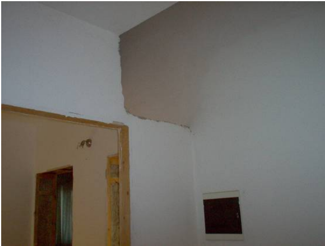
Foto 8: Ingresso piano primo con varco per il sottotetto: manca la scala